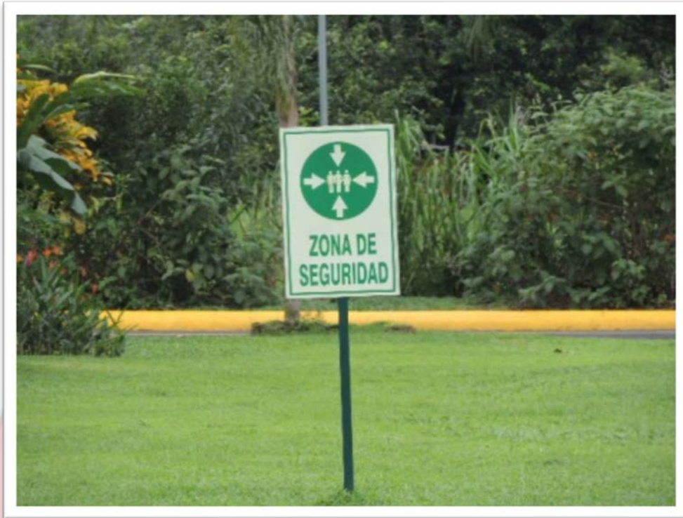
SEÑALIZACION DE PUNTO DE REUNIÓN SALIDAS DE EMERGENCIA