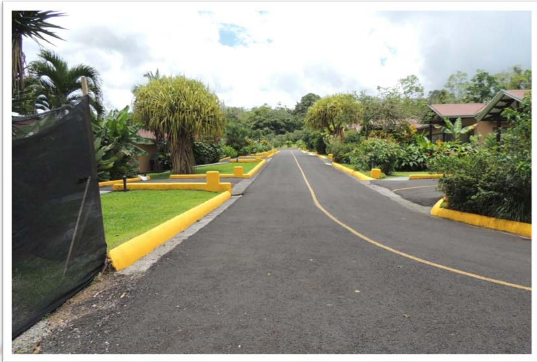
SALIDA DE LAS HABITACIONES