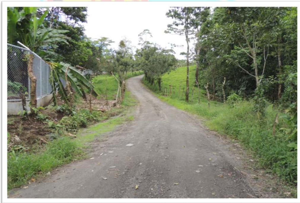
SALIDA DE EMERGENCIA #2