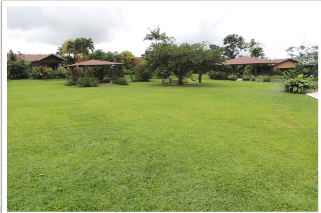
ZONA AMPLIA CON SUFICIENTE CAPACIDAD PARA PUNTO DE REUNIÓN