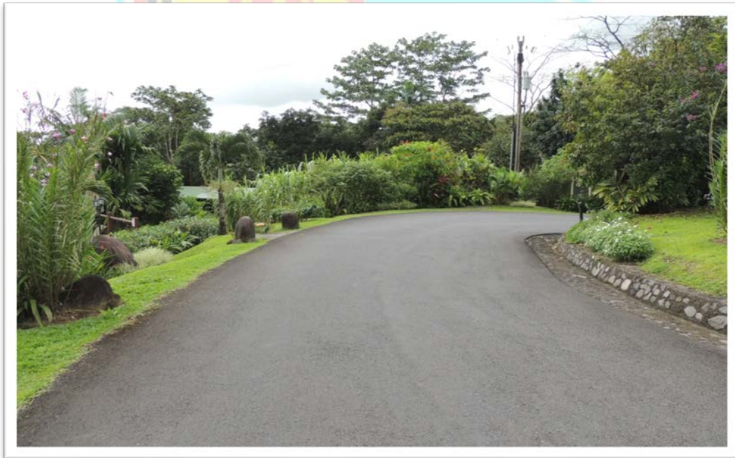
SALIDA PRINCIPAL DEL HOTEL