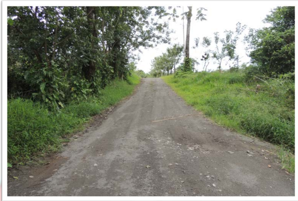
SALIDA DE EMERGENCIA #2