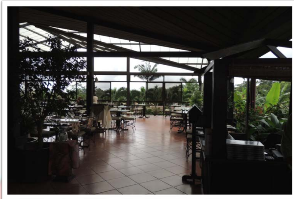
AREA DE RESTAURANTE TI CAIN