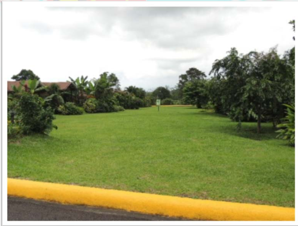
PUNTO DE REUNIÓN ENTRE HABITACIONES