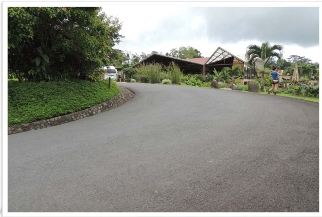
SALIDA PRINCIPAL DEL HOTEL