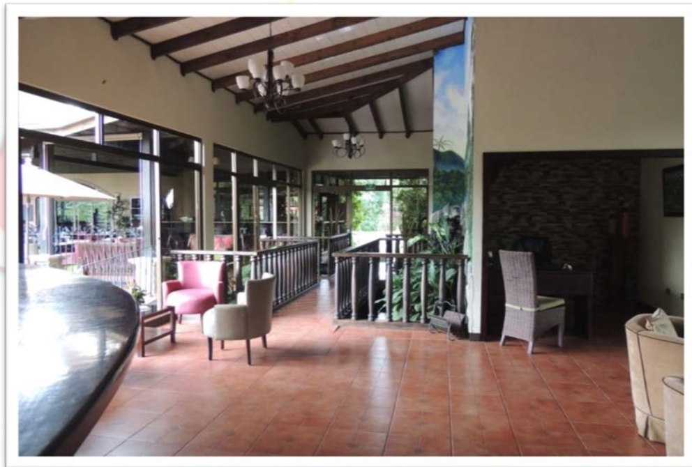
AREA DE RECEPCIÓN