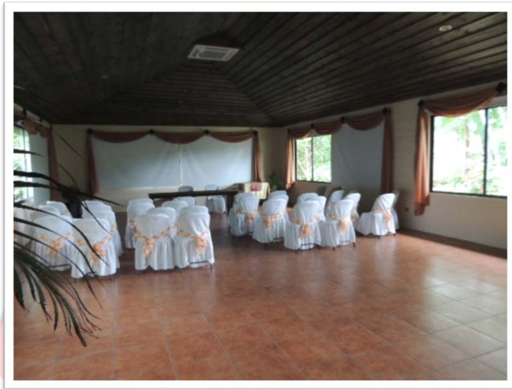
SALON CONTIGUO AL PARQUEO