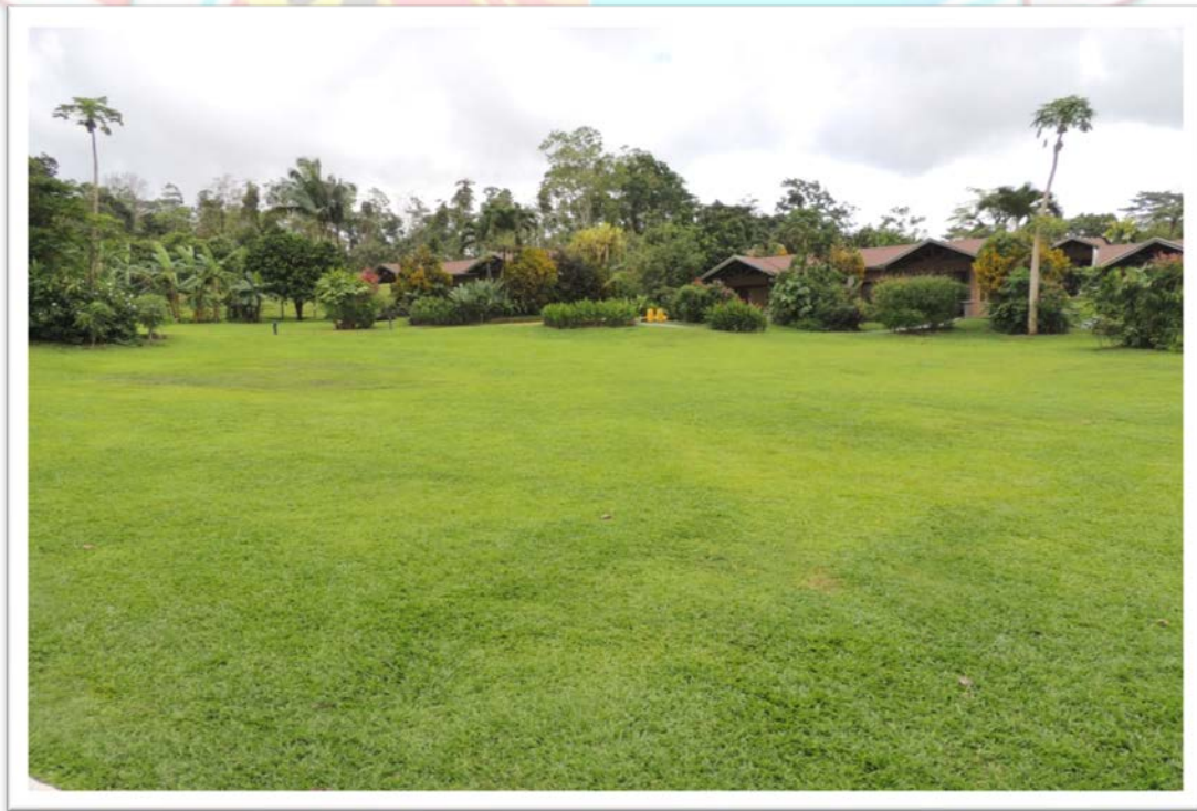
PUNTO DE REUNIÓN EN CASO DE EVACUACIÓN